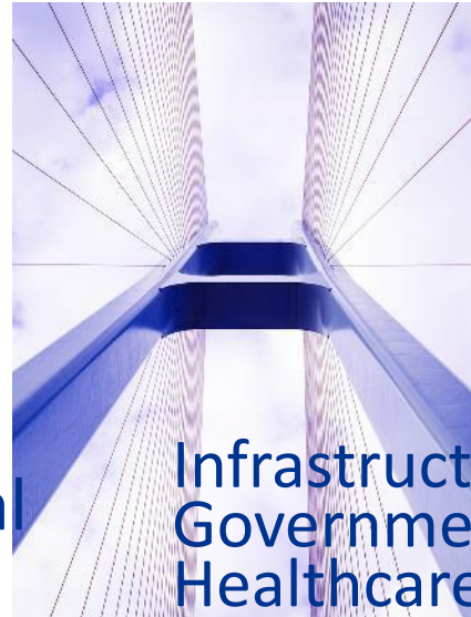
Infrastructure, Government & Healthcare