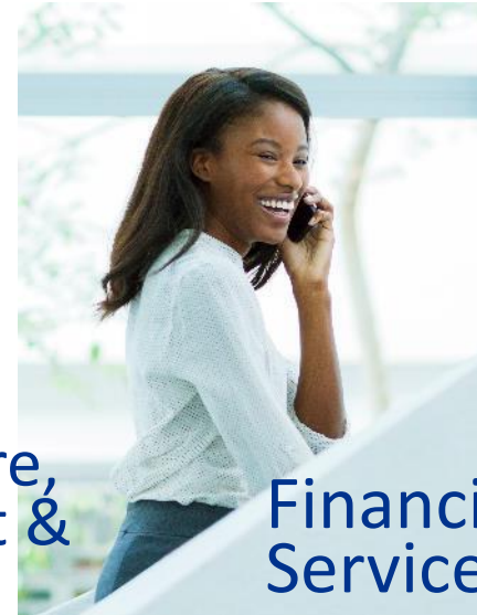
Financial Technology, Media & Services Telecommunications